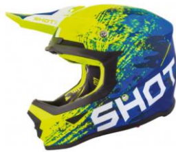
Crosshelm mit Mundschutz