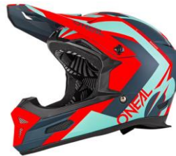
Crosshelm mit Mundschutz