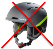
Helm mit „soft ear padding“ (normaler Touristen Ski Helm)

Hier einige Beispiele von NICHT erlaubten Helmen: